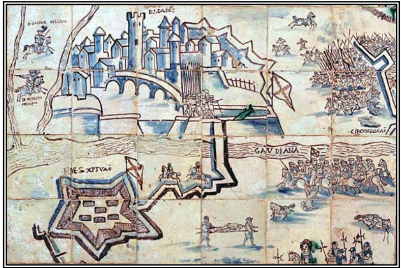
Badajoz sitiada en julio de 1658, detalle de la "Tomada do Forte S. Miguel", Palacio del Marqués de Mascarenhas. (Detalle).

Si entre 1580 y 1640 los reinos de Portugal y Castilla estuvieron regidos por un mismo monarca y su frontera quedó técnicamente diluida, la Guerra de Separación de Portugal (conocida también como Guerra de la Independencia, Secesión o Restauración de Portugal , 1640-1668), volvió a situar