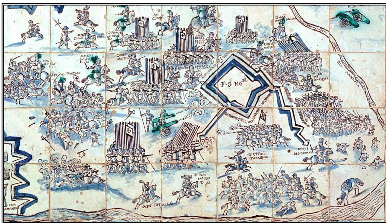
Tomada do Forte de São Miguel, Palacio del Marqués da Fronteira, Lisboa (detalle).

Durante dos meses más los portugueses fueron estrechando el cerco para aproximar sus cañones a la ciudad, destruyen las aceñas, y realizan intensos bombardeos. Los españoles, por su parte realizaron hasta seis salidas más en las que causaron bajas y destrucción de los trabajos y capturaron prisioneros. Aún así, las líneas enemigas se aproximaban tanto a los muros de la ciudad que se planificó la construcción de líneas interiores de defensa para el caso de que llegasen a abrir brecha.