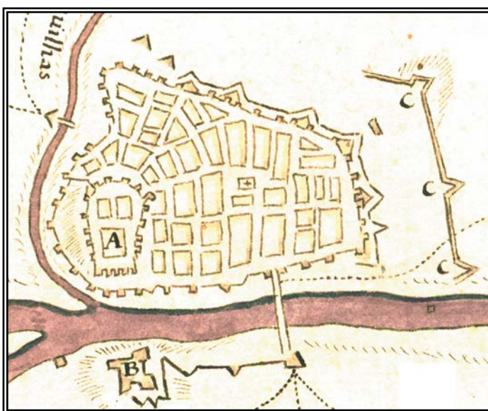
Estado de la fortificación de Badajoz durante el asedio de 1658. Obsérvese la muralla medieval con algunas medias lunas de protección en las puertas así como en obras exteriores (Detalle del plano del Archivo Militar de Estocolmo, Suecia).

La escasez de recursos de las tropas españolas 3 y la falta de atención del gobierno central permitió que los portugueses llevaran